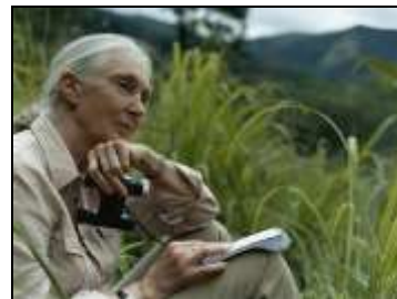
Jane Goodall