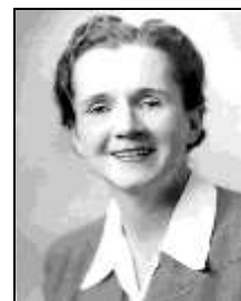
Rachel Carson