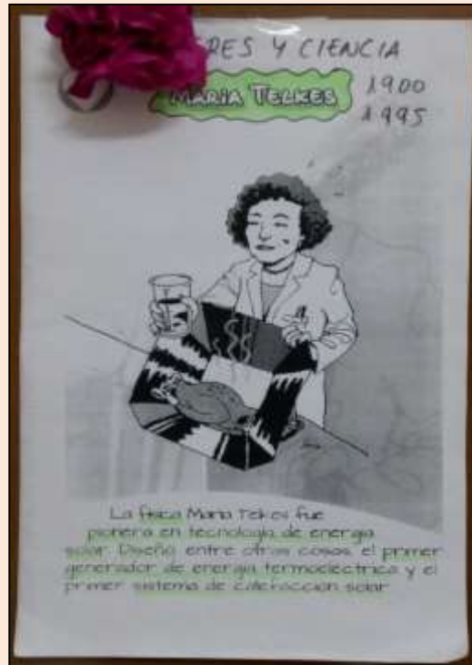
Imagen 5. Mujeres de ciencia / Iniciativa del IES El Espinillo