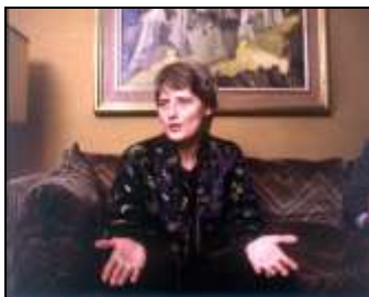
Petra Kelly