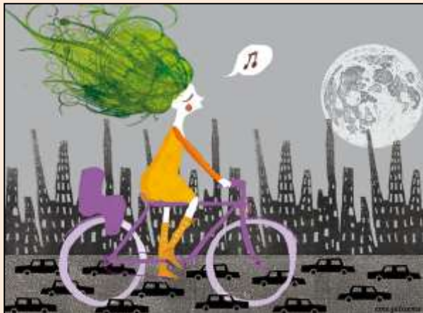
Imagen 1. Fuente Periódico Diagonal / Autor Zetaeme Graphics

El ecofeminismo es una corriente de pensamiento y un movimiento social que reivindica la existencia de sinergias entre ecologismo y feminismo. Defiende que el modelo económico y cultural de las sociedades occidentales se ha desarrollado gracias a la explotación de los recursos naturales que nos aporta el planeta Tierra sin tener en cuenta ni la huella ecológica de estas actividades ni la capacidad de carga del planeta, y gracias a los trabajos de cuidados realizados mayoritariamente por mujeres de manera gratuita y que permiten que los mercados dispongan de