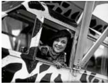
Osa Helen Leighty / Fuente: Wikipedia