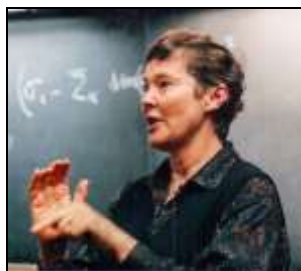
Helen Quinn