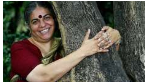
Vandana Shiva