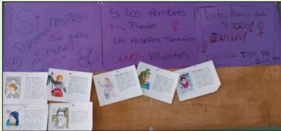
Imagen 6. Corcho del IES Jaime Vera de Tetuán.