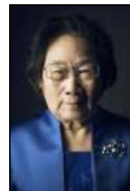
Tu Youyou