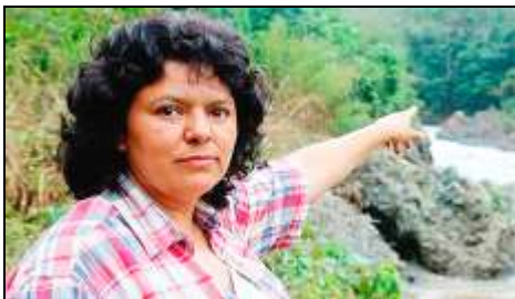
Berta Cáceres

Además de utilizar la siguiente información para completar vuestro " Pasapalabra ", también podéis preparar fichas para adaptar el famoso juego " ¿Quién es quién? " como en este ejemplo: