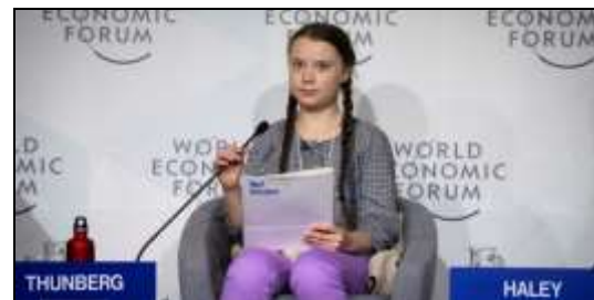
Greta Thunberg