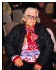
Francoise D'Eauboune / Periódico Diagonal