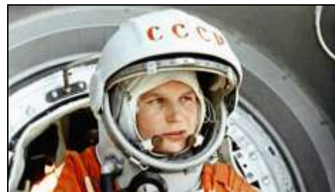
Valentina Tereshkova