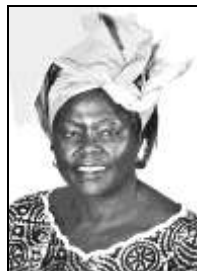
Wangari Maathai