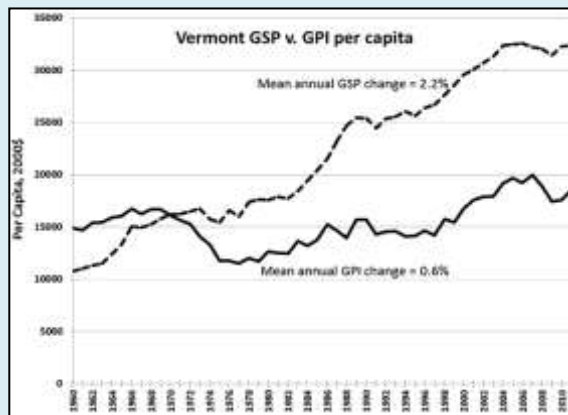
Fig 2. Evolución del PIB (GSP) vs Evolución del IPR (GPI) en el estado de Vermont

Deuda de cuidados: término concebido para visibilizar el desigual reparto de responsabilidades y cargas de trabajo de cuidados entre hombres y mujeres. Sería la relación entre el tiempo y la energía que las personas reciben para atender sus necesidades (su “Huella de cuidados”) y el que aportan para garantizar la continuidad de otras vidas humanas. El balance de esa deuda sería negativo para la mayor parte de los hombres que consumen más energía cuidadora de la que aportan. Para la mayor parte de las mujeres, el balance sería altamente positivo.