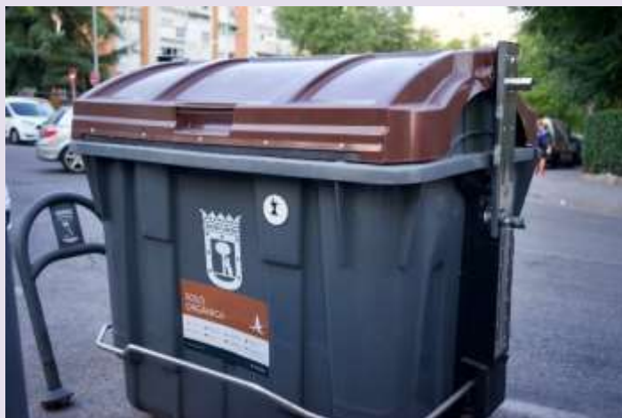
Imagen 3. Contenedor marrón

marrón. Y por el otro, el resto de residuos no reciclables, que se continúa denominando fracción resto y va al cubo gris con tapa naranja.