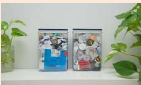
Imagen 8.

Además de retos para actuar en favor de nuestro entorno inmediato, también podemos impulsar otros que vayan a una de las raíces del problema de la generación de residuos: nuestros hábitos de consumo