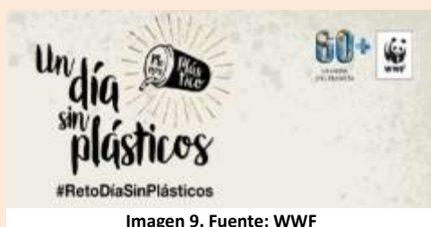
Imagen 9.

Las personas que tratan de llevar una vida "residuo cero" proponen este sencillo reto. Cada semana podemos guardar todos los plásticos que usamos y los domingos hacerles una foto con un único objetivo: reducirlo. Semana tras semana se irá reduciendo nuestra producción de residuos plásticos, hasta que quepan en un frasco.