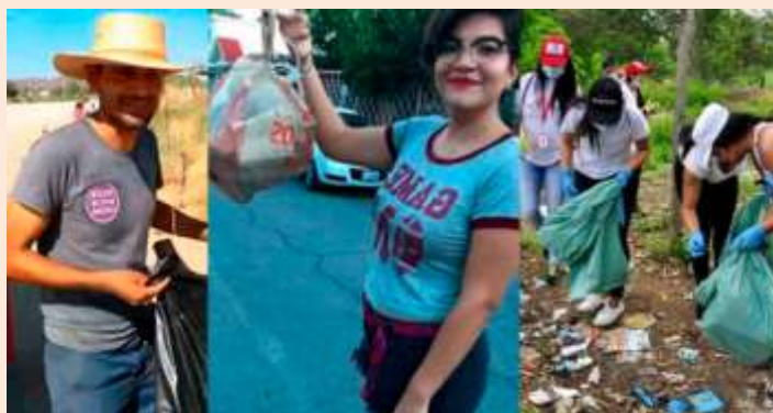
Imagen 5.

Este reto nos invita a salir a la calle o a nuestros patios a buscar esos rincones secretos en los que se acumula la basura. Lugares que son conocidos por todo el barrio (puertas afuera del centro) o por la comunidad educativa (puertas adentro del centro), pero que no sabemos muy bien porque se acaban llenando de basura.