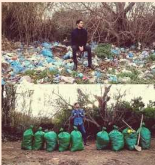
Imagen 7.

La traducción aproximada de este reto sería "la etiqueta de la basura".