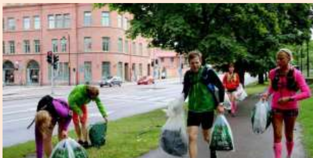
Imagen 6. Deportistas practicando "plogging"

Esta nueva modalidad deportiva, impulsada desde Suecia, aúna la práctica deportiva con la conciencia social: se trata de recoger basura cuando se sale a correr.