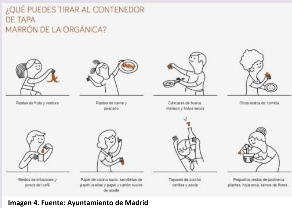
Imagen 4.

Los residuos orgánicos están compuestos de materia biodegradable, como restos de fruta y verdura, de carne y pescado, cáscaras de huevo, de marisco y de frutos secos, otros restos de comida, posos de café e infusiones, tapones de corcho (sin añadidos de plástico u otros materiales), cerillas y serrín, papel de cocina sucio, servilletas de papel usadas y pequeños restos de jardinería.